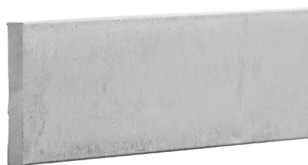
Finition sans bourrelet