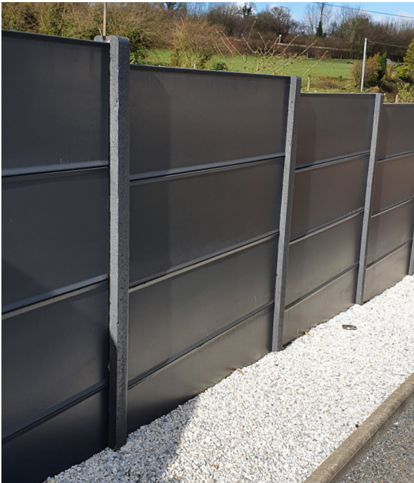
Clôture Classique ( finition avec bourrelet ), coloris Anthracite