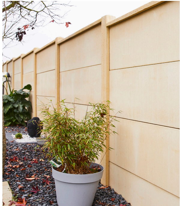
Clôture Classique ( finition sans bourrelet ) avec chaperon scellé, coloris Ton pierre