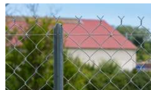
P.50 - Poteau Té